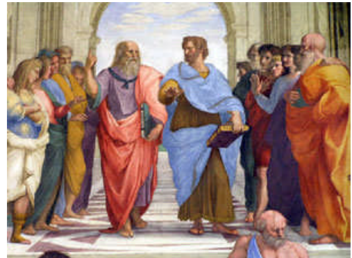
Antiikin ajoista lähtien jälleensyntyminenoppi on säilynyt voimakkaana sivuvirtauksena länsimaisessa kulttuurissa. Yksityiskohta Rafaelin maalauksesta Ateenan koulu.